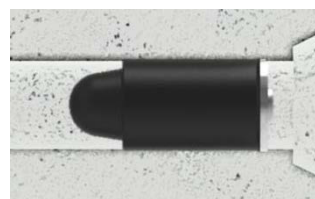
Rivestop med "invändig" installation.