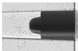
Rivestop med "utvändig" installation.