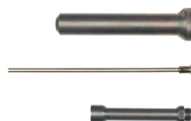
Förlängare M12 BPRT-201X