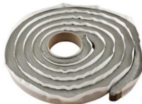
Tätband HyDra Flex FR