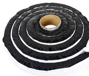
Tätband HyDra CS-102