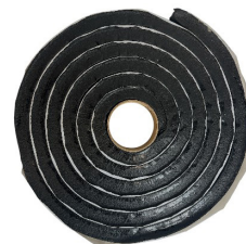
Tätband HyDra Flex