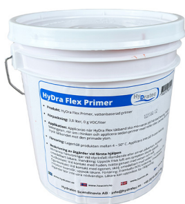
HyDra Flex Primer