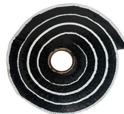
Tätband HyDra Flex XL