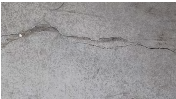
Spricka i betongolv före reparation.