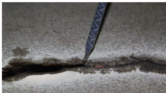
6, Strö över sand igen.