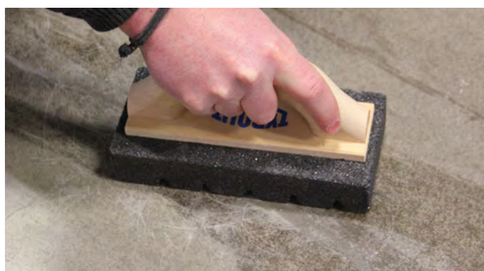
8, Putsa ytan med sandpapper/kloss.