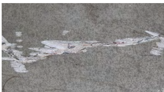
2, Sopa rent från smuts och damm.