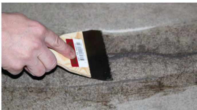
7, Efter ca 10 minuter, skrapa av överflödigt material med hjälp av en spackelspade.