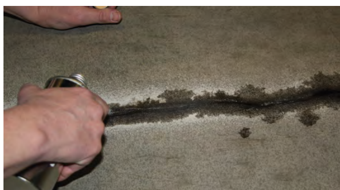
4, Strö över sand.