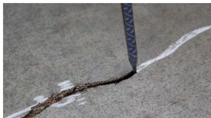
3, Applicera rikligt med Roadware 10 Minute Concrete Mender™ i sprickan.