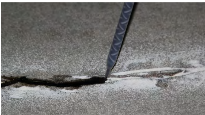
5, Förstätt att fylla Roadware 10 MinuteConcrete Mender™ i sprickan, tills det svämmar över något.