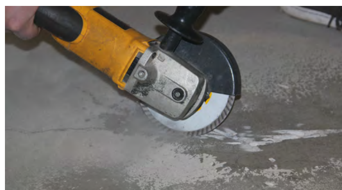
1, Rengör/skär området, med hjälp av t.ex en vinkelslip.