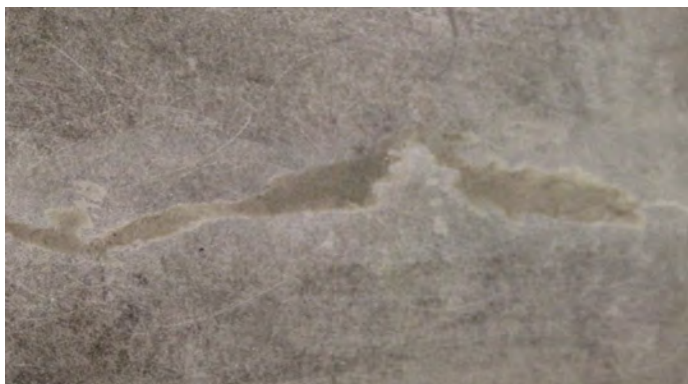
10, Efter polering.