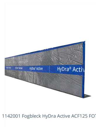
1142001 Fogbleck HyDra Active ACF125 FOT