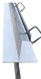
Tätplåt HyDra FB