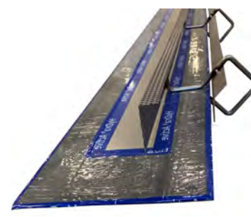
Tätplåt HyDra Active

Vi reserverar oss för tryckfel och hänvisar till att gällande version av data alltid är tillgänglig på www.hydra-tec.se eller kan rekvideras genom att kontakta vårt kontor. Aktuellt revisionsnummer står i översta vänstra hörnet.