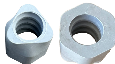
Distansmutter \varnothing 20