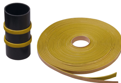
Självhäftande svällband Masterstop SK