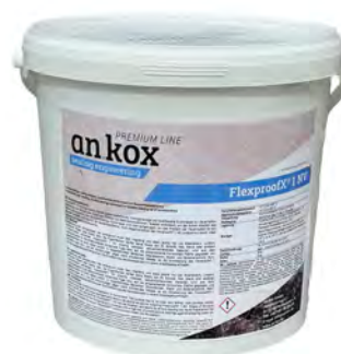
FlexproofX 1 NV