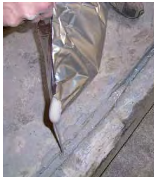
FlexproofX 1 NV (självutjämnande)