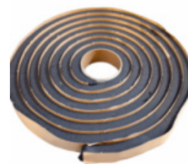
Svällband HyDra RX101 DH