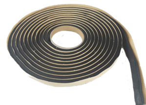
Svällband HyDra RX103