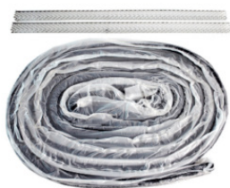
Svällband HyDra Waterstop Kit