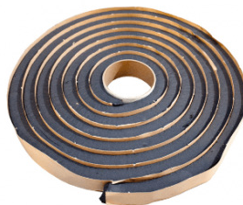
Svällband HyDra RX101