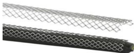
Montagenät för svällband