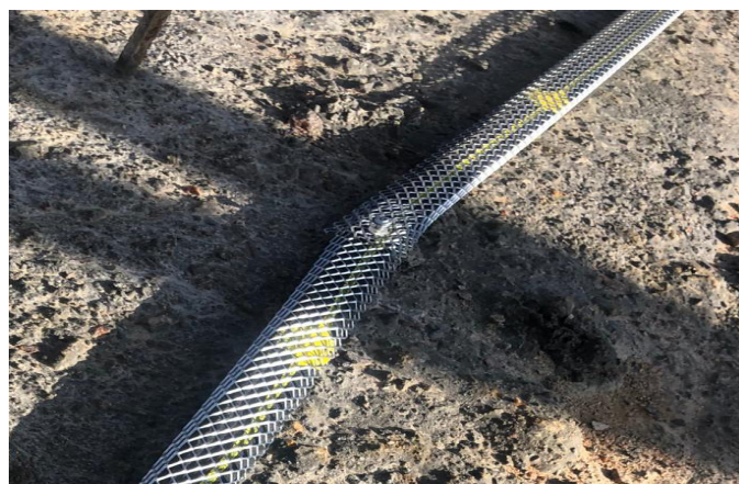
Skarvning sker ände mot ände