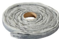
Svällband HyDra Waterstop