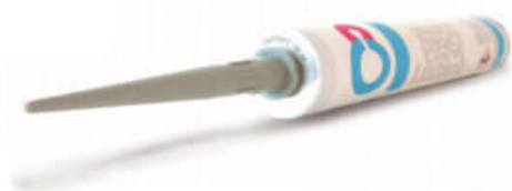
Montagelim för svällband