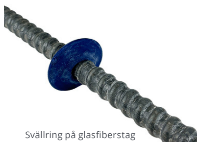
Svällring på glasfiberstag