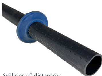
Svällring på distansrör