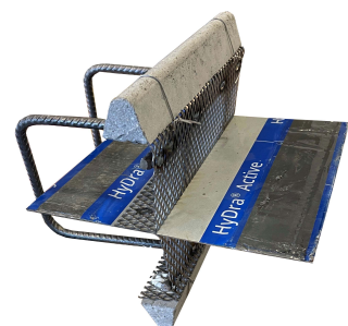
Väggavstängare med betong.