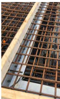
Avstängare Nr.7 HyDra FB monterad för gjutning