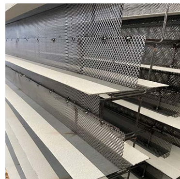
Avstängare Nr.7 HyDra FB