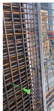
Väggavstängare Nr. 7 HyDra FB med betongdistans monterad för gjutning.