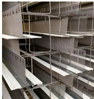
Avstängare Nr.7 HyDra FB packad för leverans.